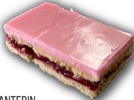
ALEKSANTERIN- LEIVOS 60 G