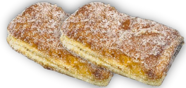
WIENERMUNKKI 90 G