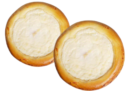
KARDEMUMMA & RAHKAPULLA 2 KPL * 120 G