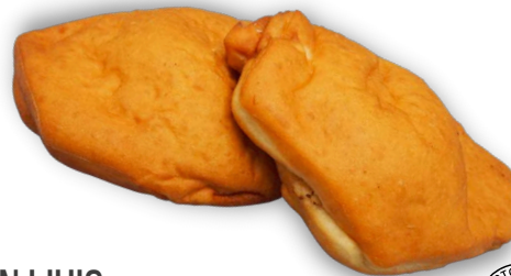
SÖRKAN LIHIS 150 G