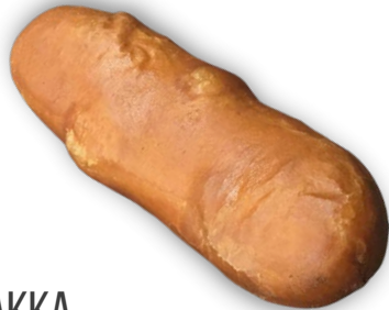
NAKKIPIIRAKKA 150 G