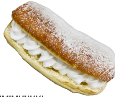
KREEMIMUNKKI 90 G