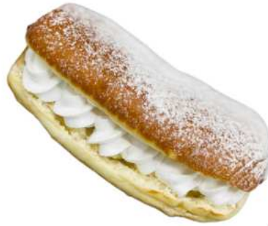
Kreemimunkki 90 G