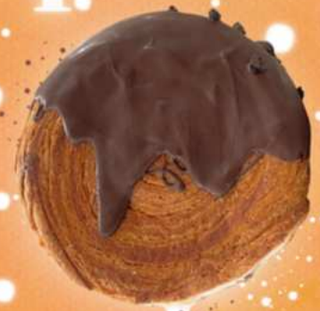
*PLEASE SQUEEZE ME! THREE CHOCOLATE