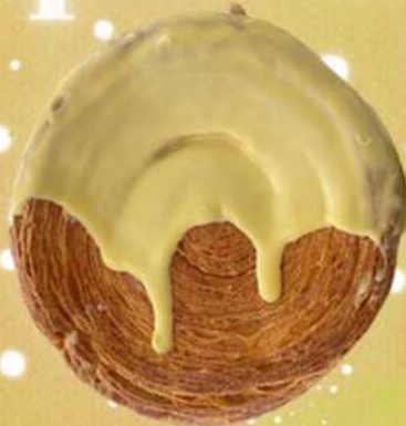
*PLEASE SQUEEZE ME! THREE NUTS