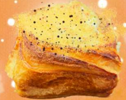
PEANUT BUTTER & CARAMEL COOKIE DOUGH