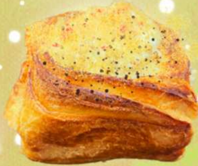
HAZELNUT CHANTILLY CHOCOLATE GANACHE