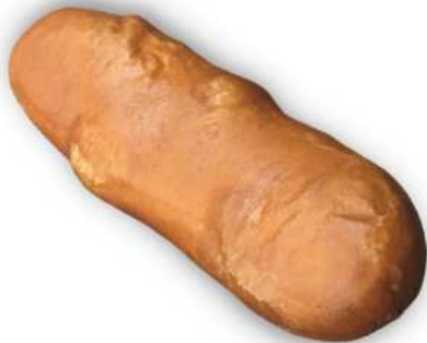
Nakkipiirakka 80 g