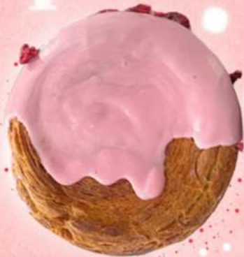
*PLEASE SQUEEZE ME! THREE BERRIES