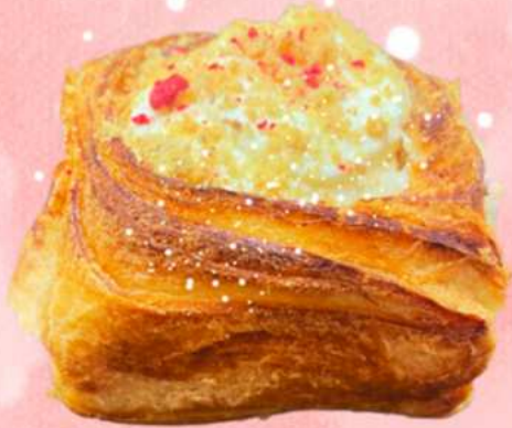
RED BERRIES CHEESECAKE