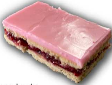
Aleksanterinleivos 60 g