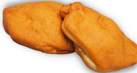
Sörkan lihis 150 g