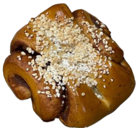
KORVAPUUSTI 90 G