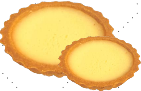
JUUSTOKAKKU ISO MINI