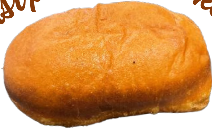
NAKKIPIIRAKKA 75 G