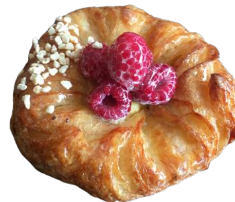
HERKKUWIENER 90 G VANILJAWIENER 90 G