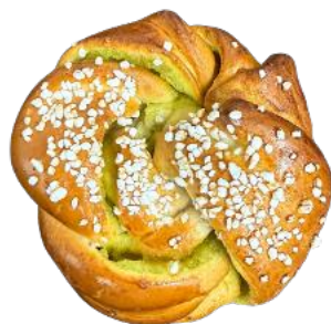
APRIKOOSIPULLA 90 G