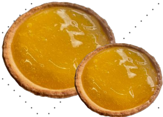
PASSIONJUUSTOKAKKU ISO MINI