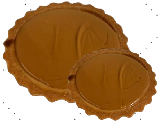
BISCOFFJUUSTOKAKKU ISO MINI