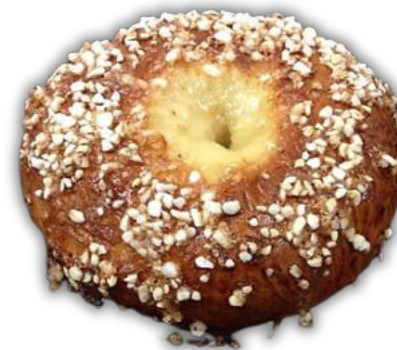
VOISILMÄPULLA 70 G