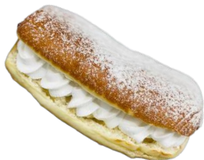
KREEMIMUNKKI 90 G