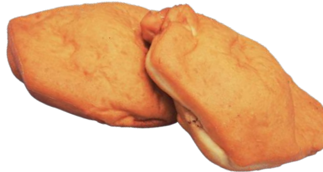
SÖRKANLIHIS 150 G