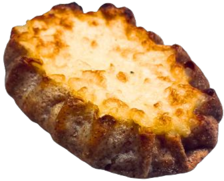
RIISIPIIRAKKA 65 G