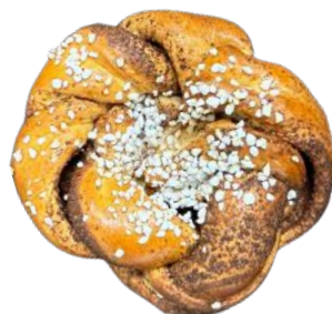
KANELIPULLA 90 G