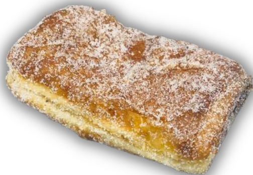
WIENERMUNKKI 90 G