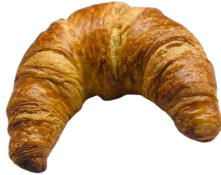
CROISSANT 65 G